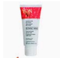
קרם לחות משזף